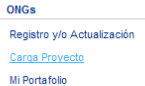
Figura 2. Carga Proyecto

El usuario debe estar registrado como una ONGs luego ir a la opción Cargar Proyecto, si ya está registrado como ONGs diríjase a la opción Carga Proyecto