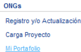
Figura 10. ONGs: Mi portafolio

Esta funcionalidad está disponible cuando un usuario registrado como ONGs, ha cargado uno o varios proyectos y desea verificar el estatus de los mismos, selecciona “Mi Portafolio” en el menú del lado izquierdo.