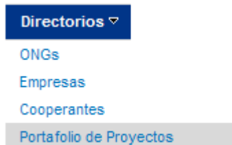
Figura 13. Directorios: Portafolio de Proyectos

Esta funcionalidad muestra una pantalla con los Proyectos cargados por las ONGs (con estatus aprobado por al Administrador de Proyectos) el cual puede ser visualizado por cualquier usuario. Para ingresar seleccione en el menú horizontal “Directorios-Portafolio de Proyectos”.