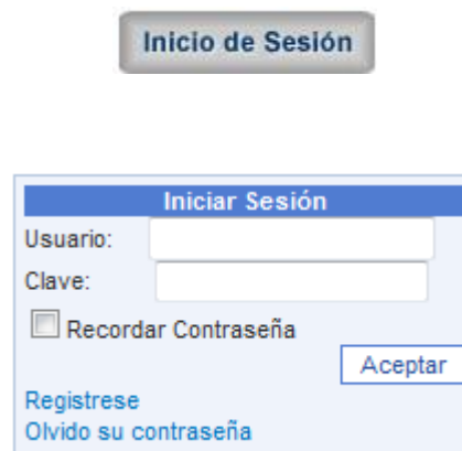
Figura 1. Ingreso al Sistema: Inicio Sesión

Una vez registrado, haga click sobre el botón Inicio de sesión, ubicado en la parte derecha del Site. Ingrese el correo con el cual se registró, más la clave que recibió en su correo electrónico.